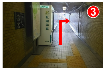
突き当たりを右に曲がります。