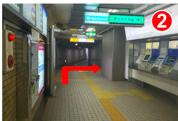
券売機を通り過ぎてすぐに右（南出口方面）に曲がります。