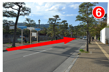
途中阪急バスのバス停がありますがそのまま通り過ぎます。