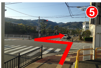
高架を抜けてすぐに信号があります。道路の左側道に渡ります。