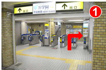
東改札口をでて右（南出口方面）に曲がります。